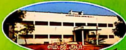
எம்.ஜி.ஆர். நூற்றாண்டு கட்டிடம்