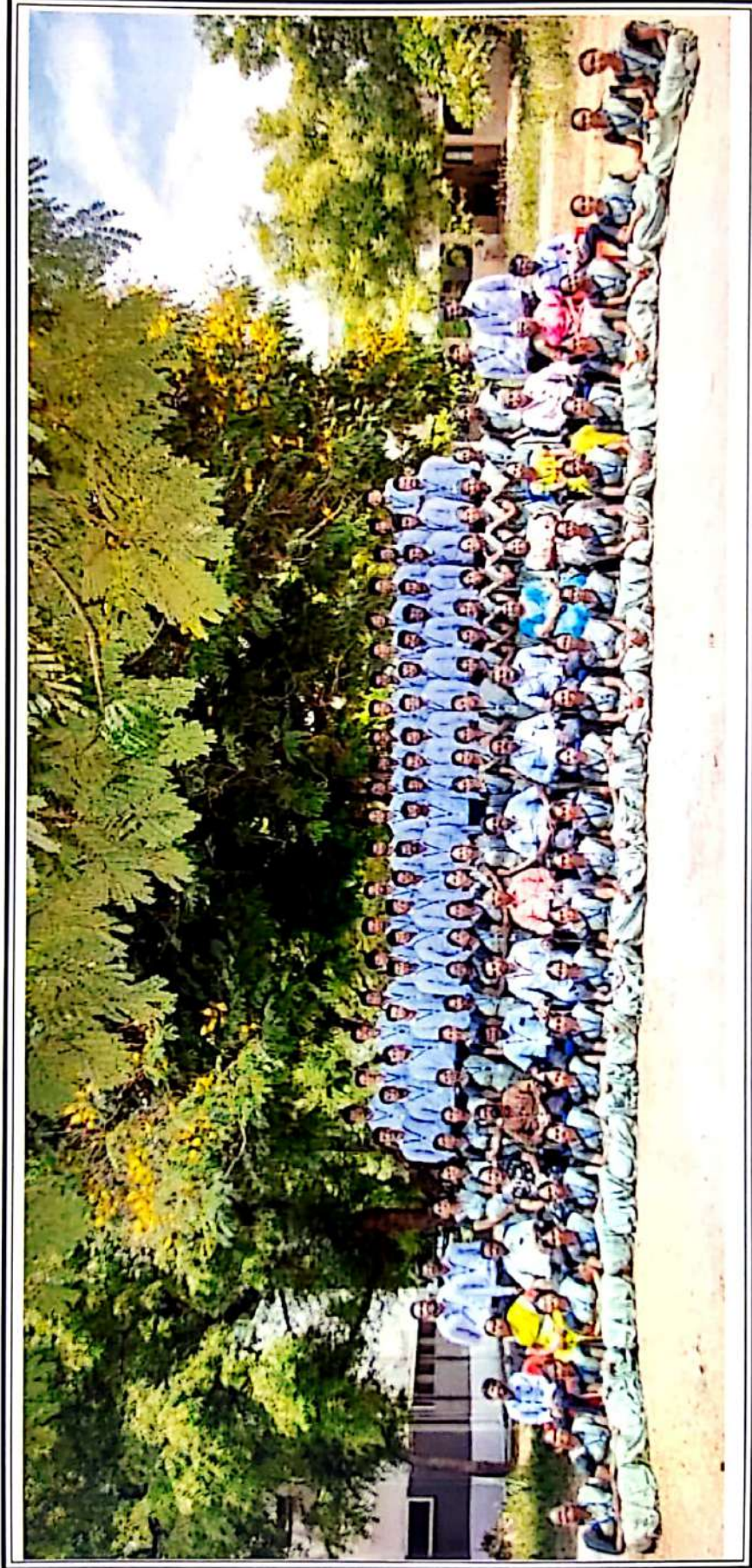
முதலாம் ஆண்டு மாணவர்கள்