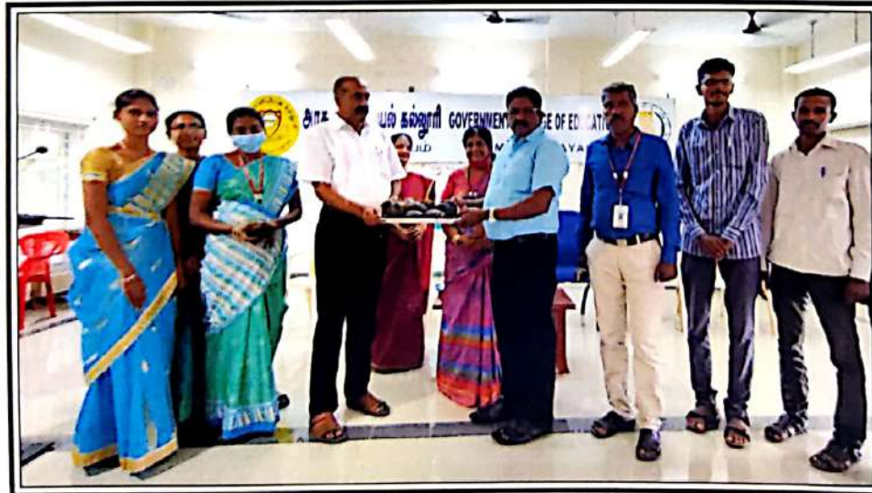
பனைமர விதைகள் பெறுதல்