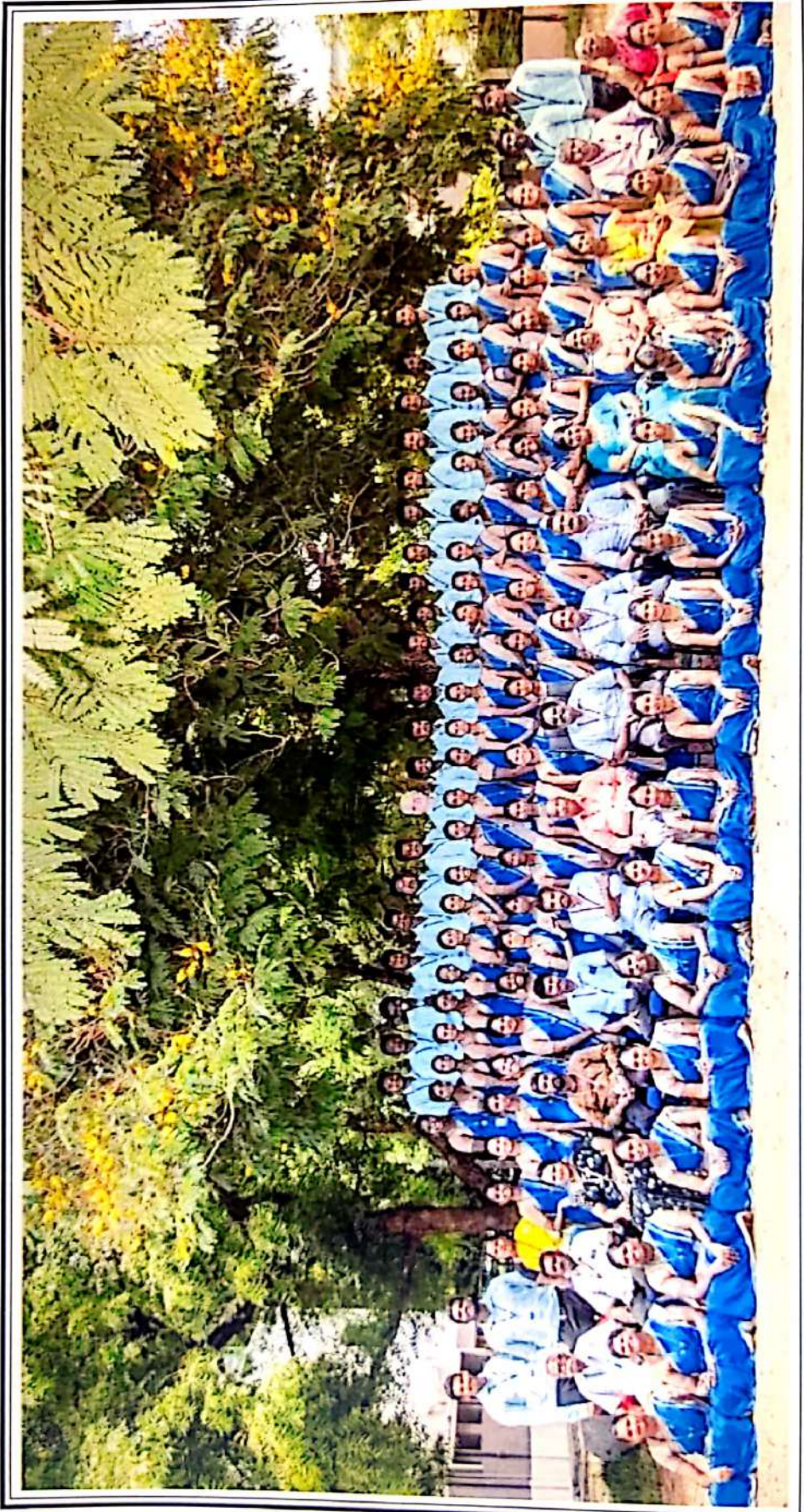
இரண்டாம் ஆண்டு மாணவர்கள்