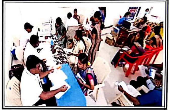
கண், பல் பொது மருத்துவப் பரிசோதனை முகாம்