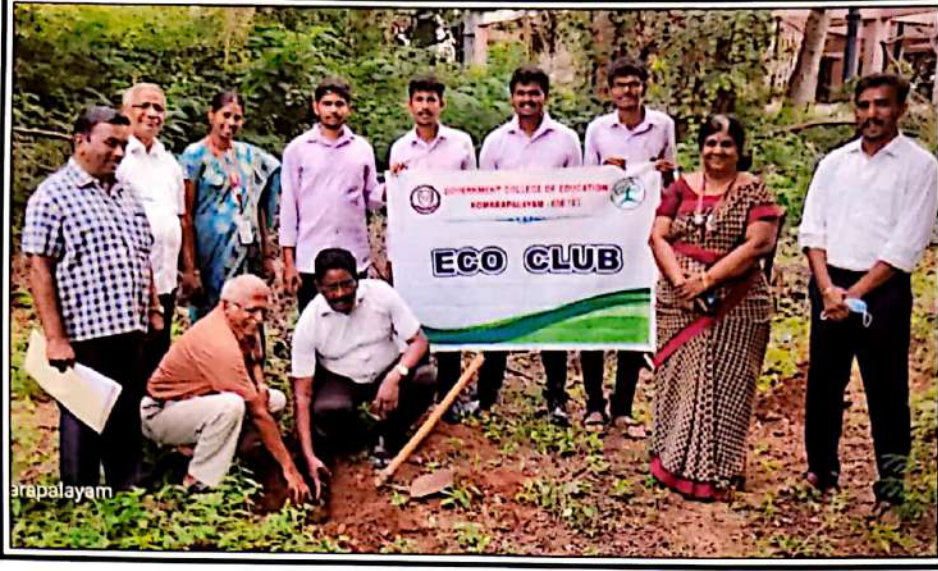
200 பனைமர விதைகள் கல்லூரி வளாகத்தில் நடப்பட்டன