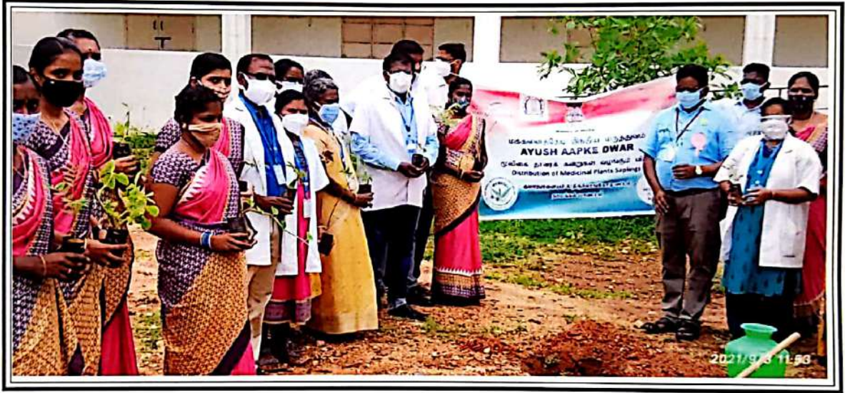
மக்களைத்தேடி இந்திய மருத்துவம் (ஆயுஷ் ஆப்கே தீவார்) திட்டத்தின்கீழ் மூலிகைக் கன்றுகள் கல்லூரி வளாகத்தில் 3-9-2021 அன்று நடப்பட்டன.