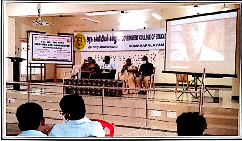
கல்வூரியில் மாணவர்களை இணைத்தல் விழா 20-10-21