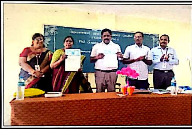
புரிந்துணர்வு ஒப்பந்தம் கைச்சாத்து