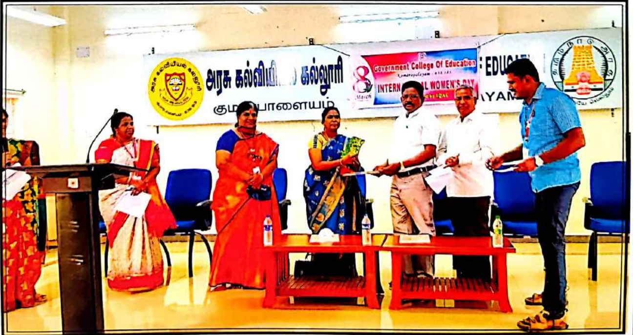
உலக மகளிர் தினவிழா