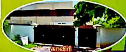
காவிரி மாணவியர் விடுதி

வளாக மொத்த பரப்பளவு = 37,785 ச.மீ. (9.34 ஏக்கர்) கல்லூரி கட்டிடப் பரப்பளவு = 11,147.32 ச.மீ. மாணவியர் விடுதி = 1,361.23 ச.மீ. மாணவ விடுதி = 395.08 ச.மீ. அலுவலர் குடியிருப்பு = 261.28 ச.மீ.