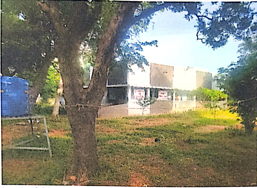
கல்லூரியில் செயல்பட்ட கொரோனா சிகிச்சை மையத்தின் ஒரு பகுதி

சிறப்பு பழுதுநீக்கம் மற்றும் வண்ணப்பூச்சுப் பணிகள்.