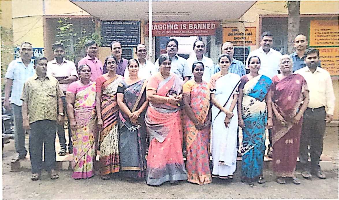
முதல்வர், கல்லூரி ஆசிரியர்கள் மற்றும் அலுவலர்கள்