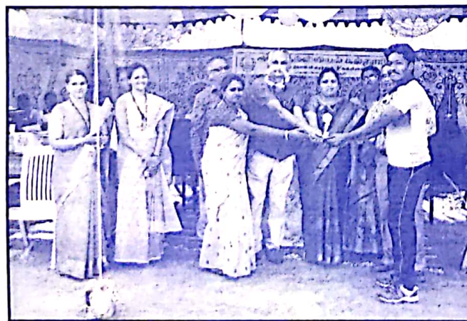
விளையாட்டு விழா நிகழ்ச்சி