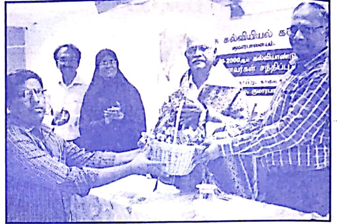
முன்னாள் மாணவர்கள் சந்திப்பு விழாவில்