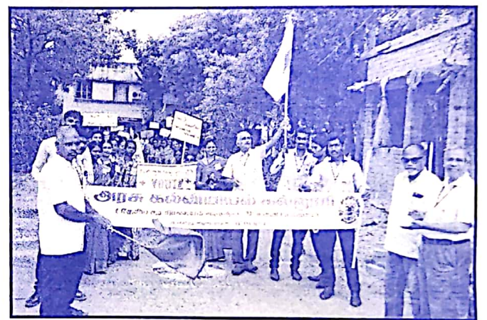
YRC விழிப்புணர்வு பேரணி