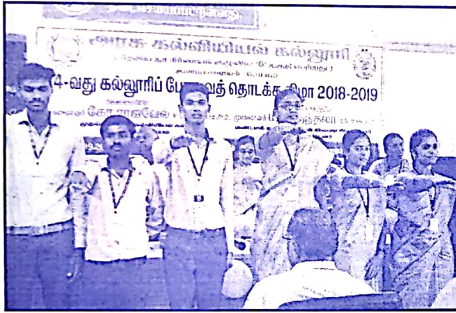
பேரவை துவக்க விழா 2018-2019