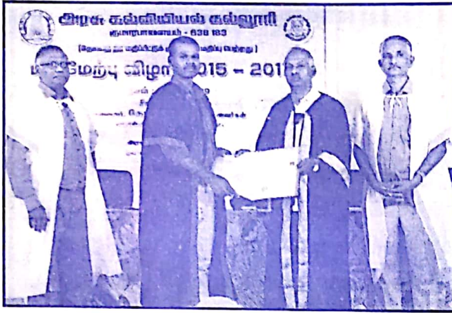
பட்டமேற்பு விழா 2015-2017